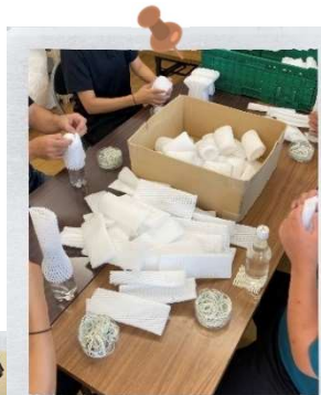
フルーツキャップ加工作業