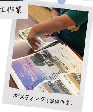
ホスティング(準備作業)

屋外・・・ハウスや畑での農作業 (トマトやネギ、ほうれん草など) 時々、他の農家さんのお手伝いもしたりします。 年に1度山辺町民農園の耕耘も請負しています。